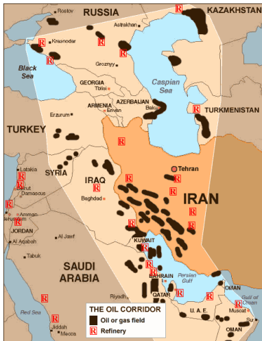
图3 伊朗油田与炼厂分布