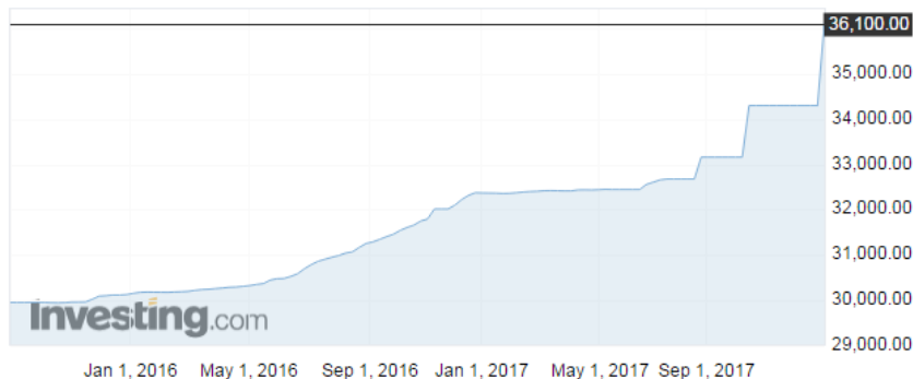
图 2 美元兑伊朗里亚尔 (USD/IRR)

USD/IRR - US Dollar Iranian Rial ▲ 36,100.00 +0.00 (+0.00%)