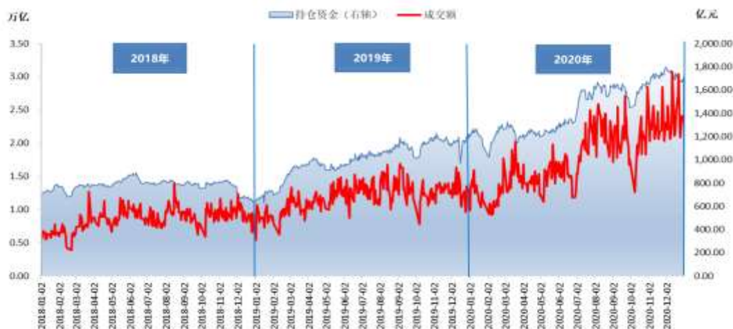
图表 1：期货市场总持仓资金与总成交额（2018/1/2-2020/12/31）

交易规模方面，由图表 1 可看到，2020 年期货市场持仓资金总量和市场成交均大幅提高。全年来看，2020 年平均持仓资金水平由 2019 年的 1004.95 亿元增加至 1446.07 亿元，同比增幅达到 43.89%。全国期货市场累计成交量（以单边计算）为 60.42 亿手，累计成交额（以单边计算）为 438.38 万亿元，较去年同比分别增长 54.07% 和 50.84%。2020 年 12 月末国内期货总持仓量接近 2285 万手，较去年同比增长 19.37%，同样创历史新高。